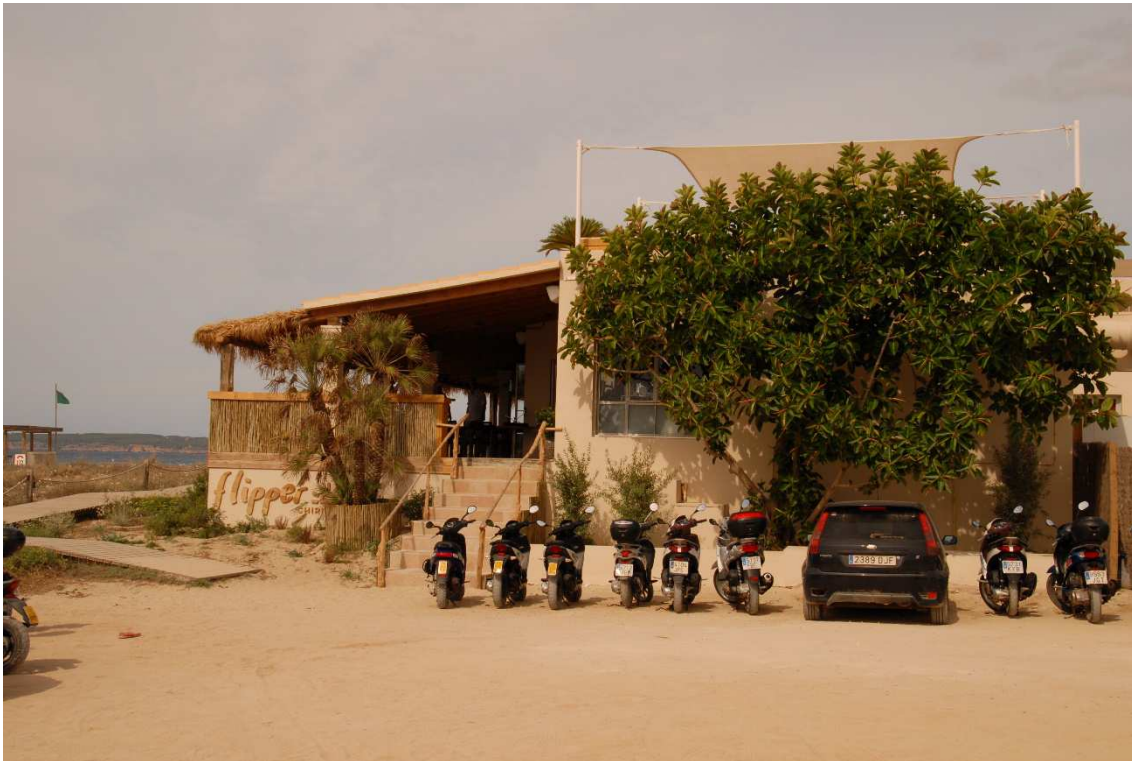
Vista desde la playa del Flipper: